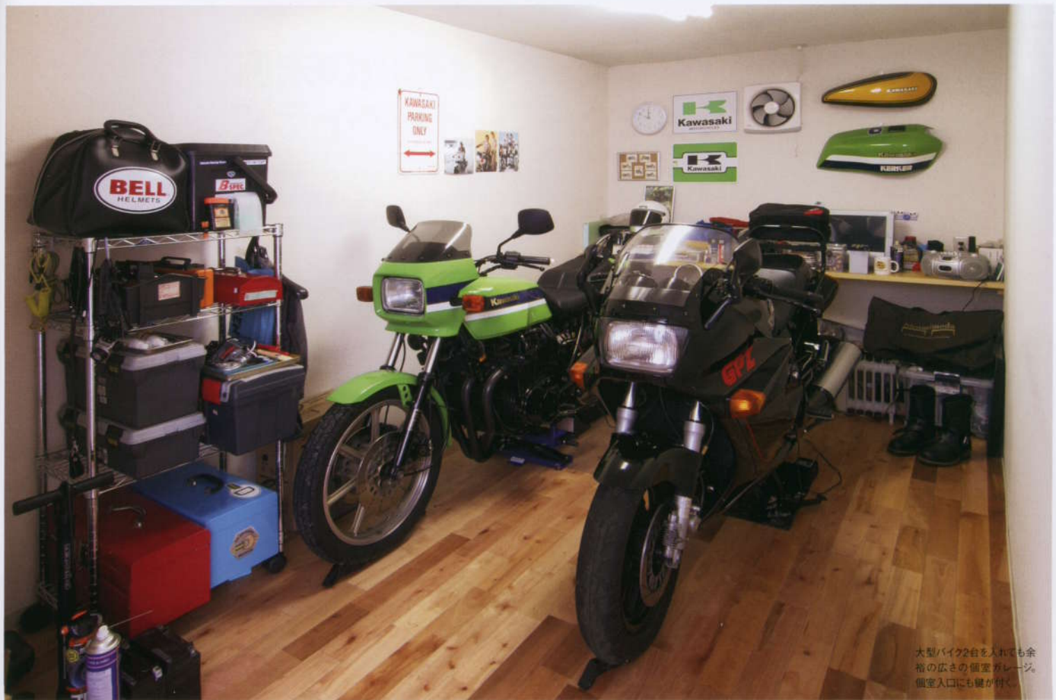
大型バイク2台を入れても余裕の広さの個室ガレージ。個室入口にも鍵が付く。