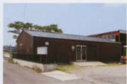
ウッディな外観のガレージ。大きな看板がないのも防犯対策のひとつ。